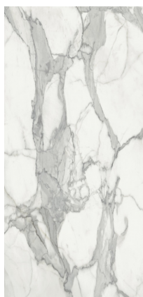
INVICTUS NATURAL BP2612L